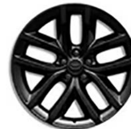
19" (STYLE 5136) - GLOSS BLACK