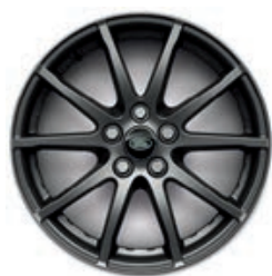
17" (STYLE 1005) - SATIN DARK GREY