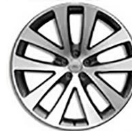
21" (STYLE 5137) - GLOSS DARK GREY / DIAMOND TURNED