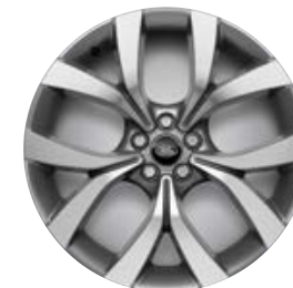
19" (STYLE 5136) - GLOSS DARK GREY / DIAMOND TURNED