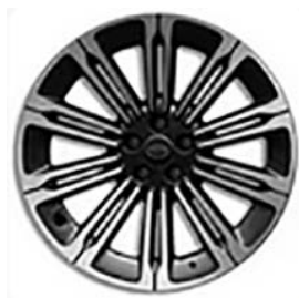
20" (STYLE 1085) - GLOSS DARK GREY / DIAMOND TURNED