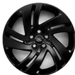
18" (STYLE 5074) - GLOSS BLACK