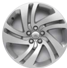
18" (STYLE 5074) - GLOSS SPARKLE SILVER