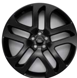
21" (STYLE 5078) - GLOSS BLACK