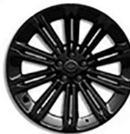
20" (STYLE 1085) - GLOSS BLACK